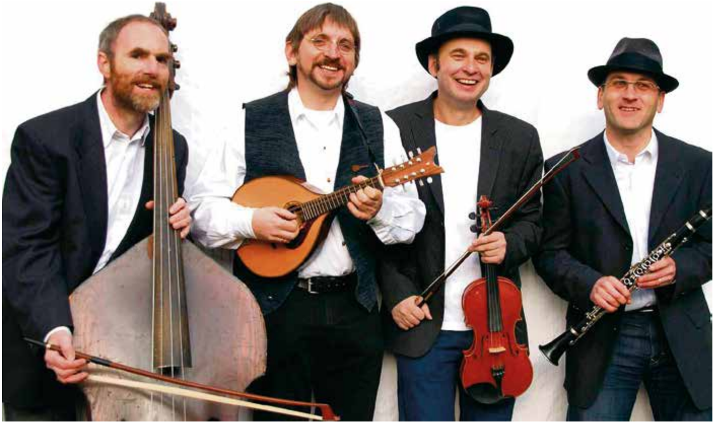
„Schmitts Katze“ begeistern mit Klezmer-Musik in der Ehemaligen Synagoge.