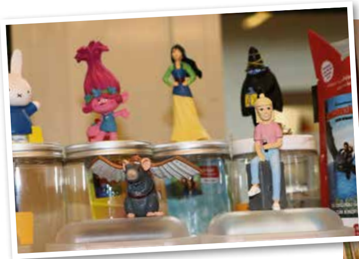
■ Nachschub: Die neuen Tonies sind da!