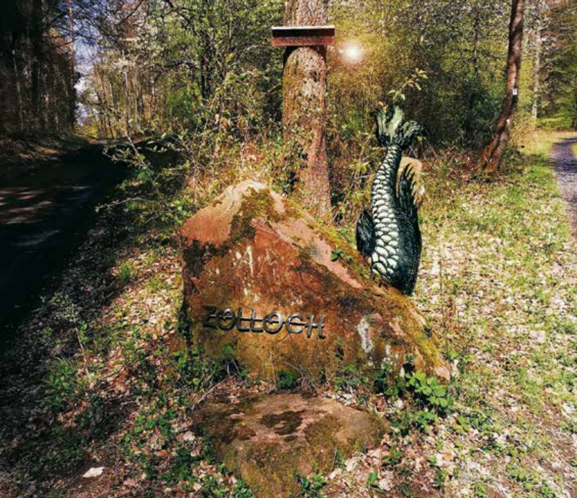
Die Chimäre, eines von Grimmelshausens Mischwesen, verschwindet gerade hinter dem Stein am Zolloch. Die Spieler*innen können dafür sorgen, dass Grimmelshausens Figuren wieder zurück in die Originalausgaben kommen.