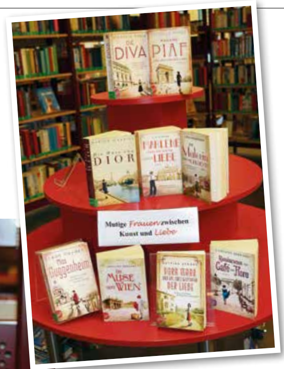
Die neue Reihe beleuchtet wahre und inspirierende Geschichten von Frauen, die gegen alle Widerstände zu Ikonen ihrer Zeit wurden.

Büchereien sind magische Orte mit einer einzigartigen Atmosphäre. Obwohl ihnen wegen des Internets, der steigenden Zahl an elektronischen Medien und diverser Streamingdienste immer wieder der Untergang prophezeit wurde, behaupten sich Bibliotheken und kommunale Leihbüchereien gegen die digitale Konkurrenz und schaffen es, eine Brücke zwischen Vergangenheit und Moderne und