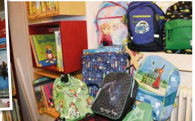
■ Jeder Leserucksack lädt ein, ein anderes Thema spielerisch zu entdecken.

nen, Künstlerinnen und Musen und kann auch in der Gelnhäuser Stadtbücherei ausgeliehen werden. Unter dem Titel „Young adults“ ist aktuelle Jugendliteratur zusammengefasst, die Jugendliche und Heranwachsende in einen besonderen Bereich des Erwachsenwerdens eintauchen lässt: Liebe und Erotik.