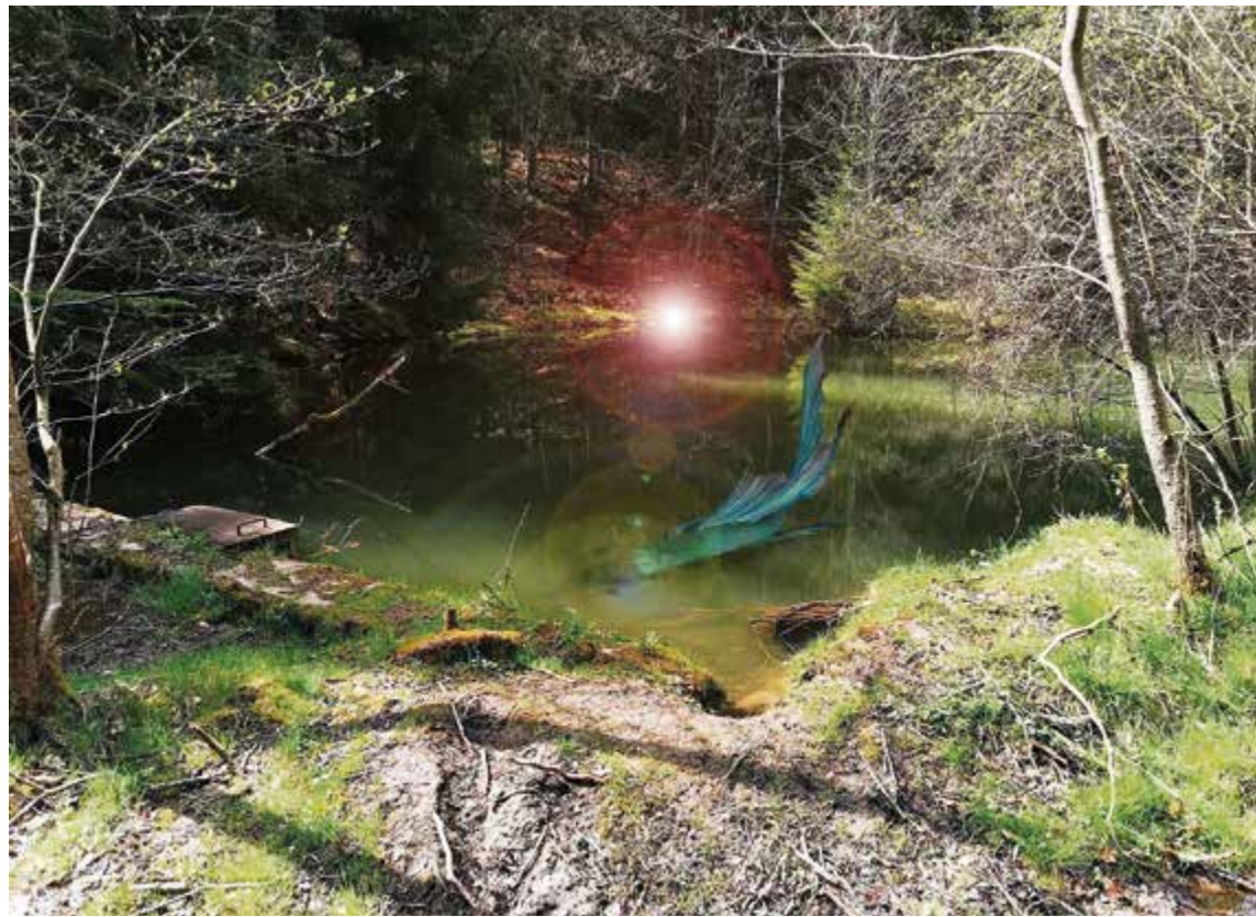
Waldbesucher wollen magische Wesen im Stadtwald beobachtet haben. Haben sich die Wasserwesen aus der Mummelsee-Episode im Löschteich niedergelassen?

einige zwielichtige und geheimnisvolle Gestalten, aber nur einer ist ein wahrer Bösewicht; und dieser muss entlarvt werden. Dafür findet jede(r) Teilnehmer*in in dem für ihre/seine Rolle zugeschnittenen Paket bestimmte Hinweise, Briefe und Requisiten vor, mittels derer die Rätsel in der Geschichte gelöst werden können. Story, Personen und Rätsel rekrutieren sich natürlich aus dem umfangreichen Werk Grimmelshausens. „So gewinnen die Teilnehmer*innen spielerisch einen Eindruck davon, wie die Stadt Gelnhausen im 17. Jahrhundert, zur Zeit des Dreißigjährigen Krieges aussah. Historisch fundiert, literarisch korrekt, fantasievoll und auch noch kurzweilig“, verspricht Simone Grünewald. Die Spielstarts werden rechtzeitig in den Medien und auf den Plattformen der Stadt Gelnhausen bekannt gegeben.