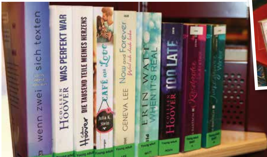
Love and Erotik spielen bei der Literatur unter dem Titel „young adults“ eine wichtige Rolle.

stärkt ihre tragende Rolle im Bereich Bildung und Kultur und erweitert ihren Service