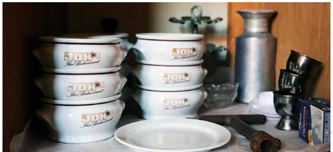
Viele Kund*innen erinnern sich noch an Gerichte, die sie im Joh-Restaurant besonders gerne gegessen haben. Unter anderem konnten diese Suppentassen für die Nachwelt erhalten werden.

Damit die Geschichte des Kaufhauses JOH auch für die zukünftigen Generationen lebendig bleibt, lädt das Stadtarchiv dazu ein, Teil der lokalen Geschichtsschreibung zu werden. Weitere Geschichten, gerne auch ganz „analog“ auf Papier, sind willkommen, ebenso wie Erinnerungsstücke. Soweit dies die aktuellen Coronaregelungen ermöglichen, ist eine Abgabe während der Öffnungszeiten der Grimmshausen Stadtbücherei sowie am Empfang des Museums (Stadtschreiberei 3, ehemalige Augusta-Schule) möglich. Das Stadtarchiv ist unter der E-Mail-Adresse archiv@gelnhausen.de erreichbar.