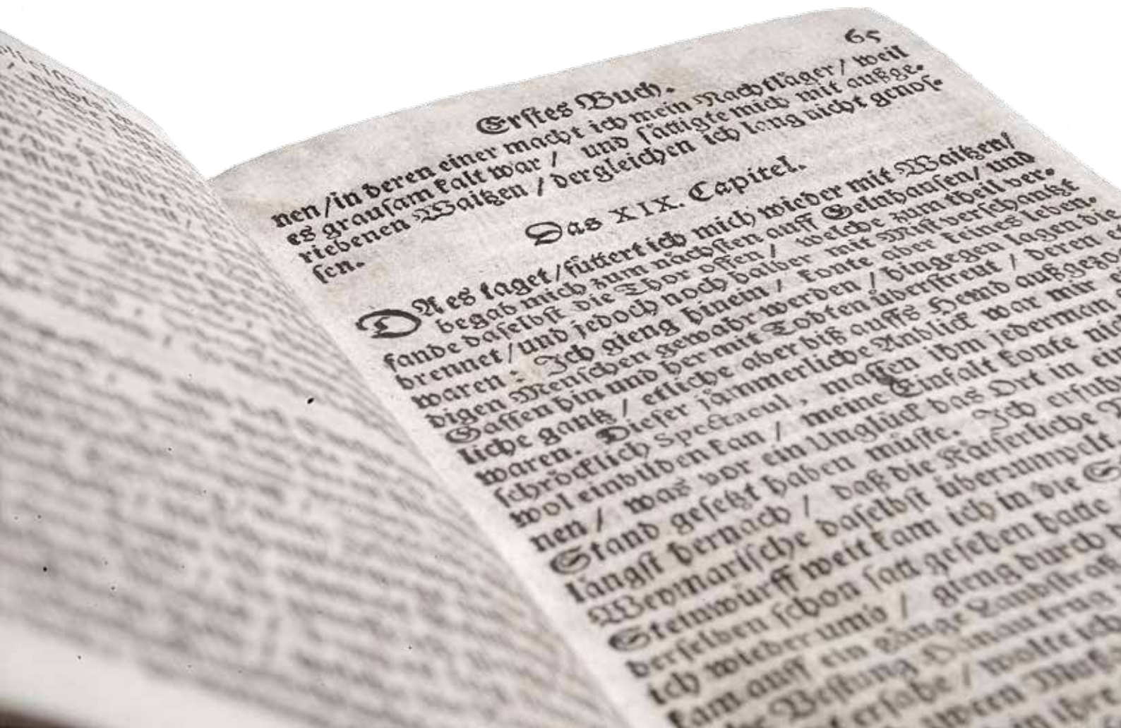
Der abentheuerliche Simplicissimus Teutsch: Ein Blick ins Werk von Grimmelshausen.

gendem Zitat, das er seinem Titelhelden in den Mund legt: