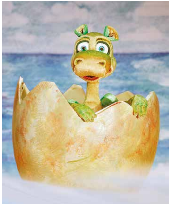
Kinderliebling Urmel und seine Freunde kommen samt Professor Habakuk Tibatong als Figurentheater nach Gelnhausen.

lementen wird das Stück weit mehr als Figurentheater sein. Professor Habakuk Tibatong und seine sprechenden Tiere sind am 29. September in der Kulturherberge in Gelnhausen (Schützengraben 5) zu bewundern. Die Veranstaltung wurde vom April in den September verschoben. Karten kosten für Kinder bis 16 Jahre je fünf Euro, für Erwachsene je sieben Euro.