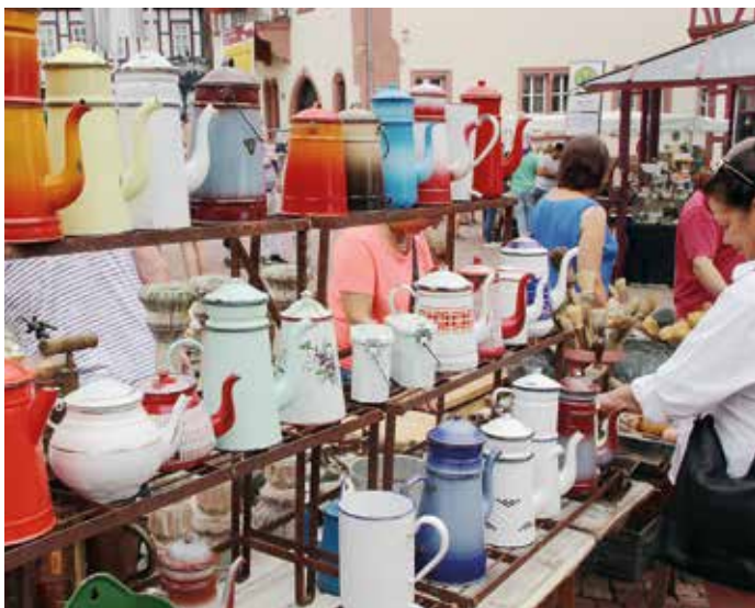
Auf der Suche nach dem Schnäppchen: Impressionen von Alles uff die Gass und dem Antikmarkt.

Also, wohin am Sonntag, den 25.07.2021? Natürlich nach Gelnhausen zu „Alles uff die Gass“ mit Antikmarkt und Kindersommer.