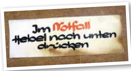
Ein Hinweisschild von einem der Notausgänge.

Sie und ihre Kameraden geleistet haben sowieso.