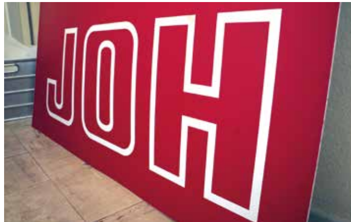
Ein Schild aus der jüngeren Vergangenheit.